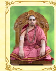
शृंगेरी जगद्गुरु अनंतश्रीविभूषित विधुशेखर भारती स्वामीजी सन्निधानम्