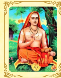
परमशिवावतार जगद्गुरु श्री आद्य शंकराचार्य