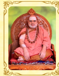
शृंगेरी जगद्गुरु शंकराचार्य अनंतश्रीविभूषित भारतीतीर्थ महास्वामीजी महासन्निधानम्